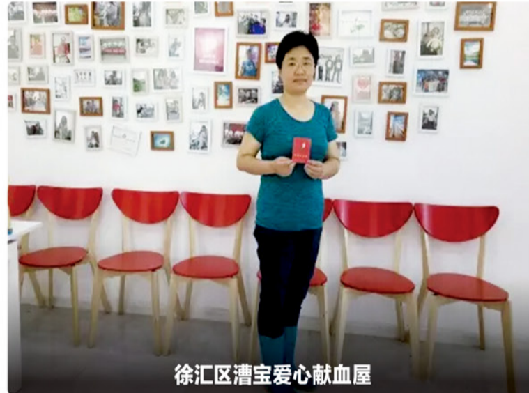
徐汇区漕宝爱心献血屋