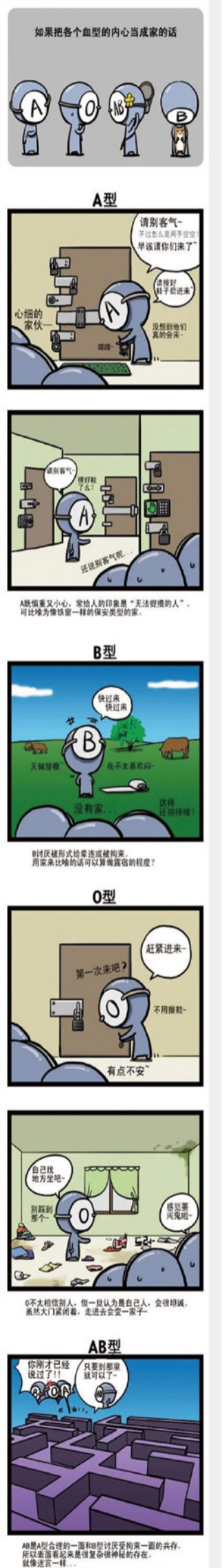
摘编自 血型漫画的微博