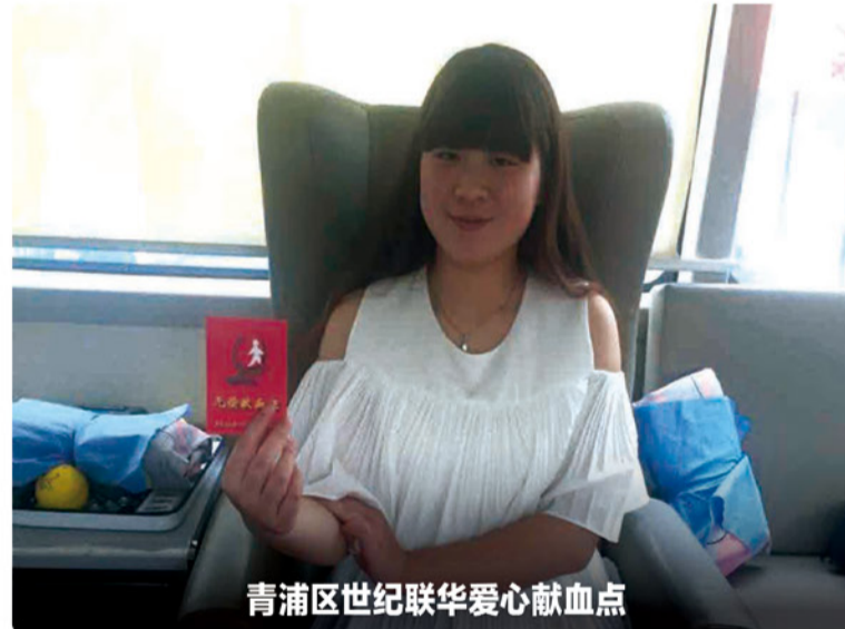
青浦区世纪联华爱心献血点