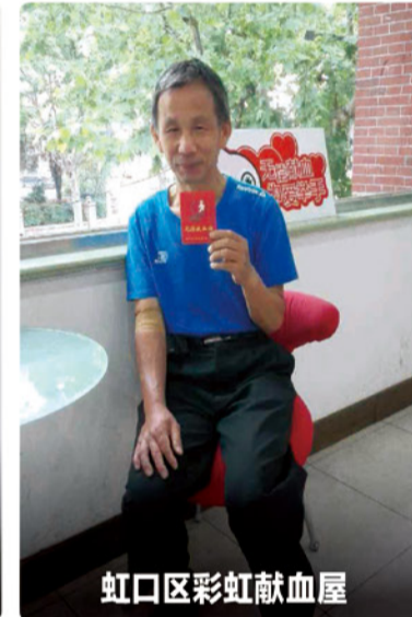
虹口区彩虹献血屋